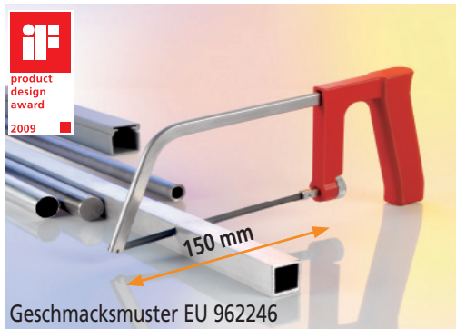
Geschmacksmuster EU 962246