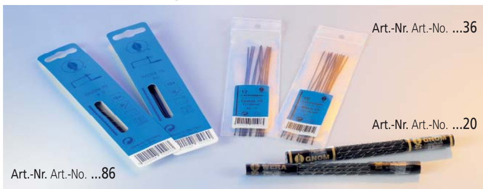
Art.-Nr. Art.-No. ...36

Dutzend- und grosweise verpackt Packed by the dozen and the gross